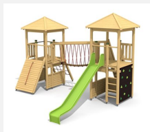
BM.050.1 Spielanlage Ennetbürgen