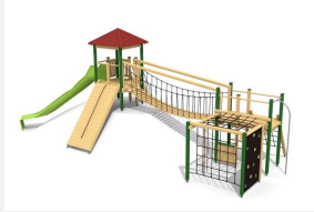
BM.060.2.L Spielanlage Stans - Hügel - farbig lasiert