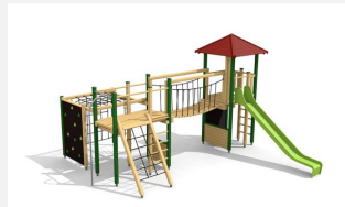
BM.060.1.L Spielanlage Stans - farbig lasiert