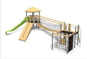
BM.060.2.M Spielanlage Stans - Hügel classic steel