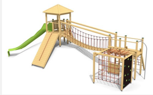
BM.060.2 Spielanlage Stans - Hügel