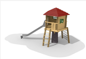
BN.060.3.L Hinkelsteinhütte 175 mit Inox Rutsche - lasiert