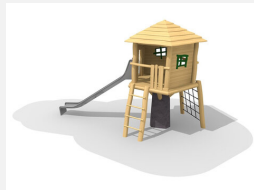
BN.060.3 Hinkelsteinhütte 175 mit Inox Rutsche