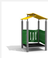
BS.010.M Spielhaus steel