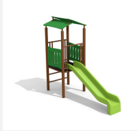
BS.012.MC Spielhaus mit Rutsche steel color