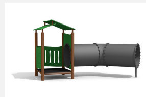
BS.011.MC Höhlenhaus steel color