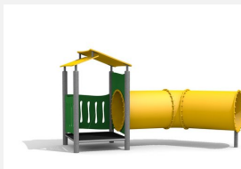
BS.011.M Höhlenhaus steel