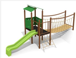
BS.040.1.MC Spieldorf 2 an Hügel steel color