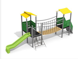
BS.040.M Spieldorf 2 steel