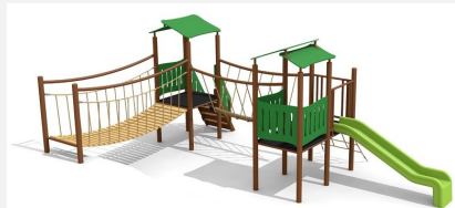
BS.040.2.MC Grosses Spieldorf 2 an Hügel steel color