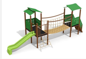
BS.040.MC Spieldorf 2 steel color