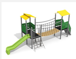
BS.040.M Spieldorf 2 steel