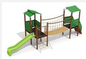
BS.040.MC Spieldorf 2 steel color