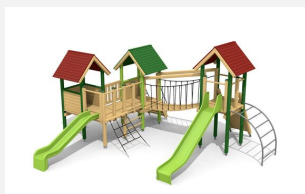
BS.050.L Spieldorf 3 farbig lasiert