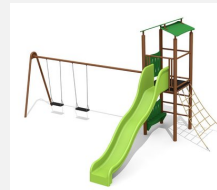
BS.070.2.MC Kletterturm 2 mit 2er Schaukel steel color