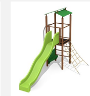
BS.070.MC Kletterturm 2 steel color