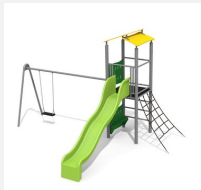
BS.070.1.M Kletterturm 2 mit 1er Schaukel steel