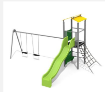
BS.070.2.M Kletterturm 2 mit 2er Schaukel steel