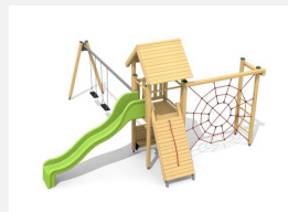
BS.080.2 Kletterturm Kombi 1 mit 2er Schaukel