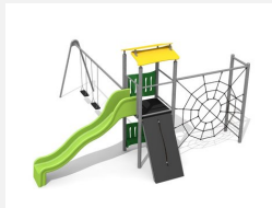
BS.080.2.M Kletterturm Kombi 1 mit 2er Schaukel steel