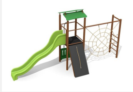
BS.080.MC Kletterturm Kombi 1 steel color