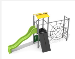
BS.080.M Kletterturm Kombi 1 steel