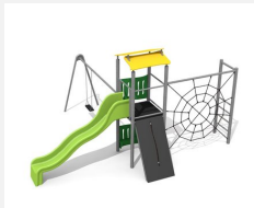
BS.080.1.M Kletterturm Kombi 1 mit 1er Schaukel steel