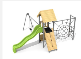
BS.080.1.HM Kletterturm Kombi 1 mit 1er Schaukel classic steel