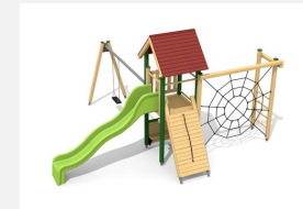
BS.080.1.L Kletterturm Kombi 1 mit 1er Schaukel - lasiert