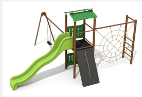
BS.080.1.MC Kletterturm Kombi 1 mit 1er Schaukel steel color