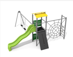
BS.080.2.M Kletterturm Kombi 1 mit 2er Schaukel steel