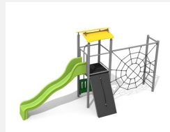
BS.080.M Kletterturm Kombi 1 steel