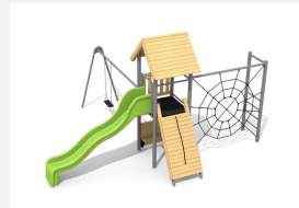
BS.080.1.HM Kletterturm Kombi 1 mit 1er Schaukel classic steel