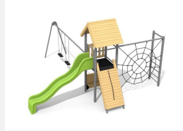
BS.080.2.HM Kletterturm Kombi 1 mit 2er Schaukel classic steel