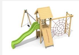
BS.080.1 Kletterturm Kombi 1 mit 1er Schaukel