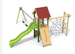
BS.080.2.L Kletterturm Kombi 1 mit 2er Schaukel farb. lasiert