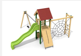
BS.080.1.L Kletterturm Kombi 1 mit 1er Schaukel - lasiert