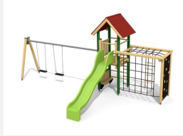
BS.090.2.L Kletterturm Kombi 2 mit 2er Schaukel farb. lasiert