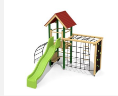
BS.090.L Kletterturm Kombi 2 - farbig lasiert