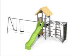
BS.090.2.HM Kletterturm Kombi 2 mit 2er Schaukel classic steel