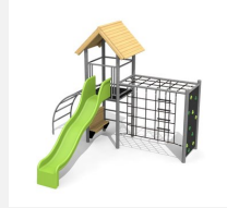
BS.090.HM Kletterturm Kombi 2 classic steel