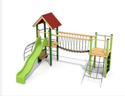
BS.100.L Kletterlandschaft 1 - farbig lasiert