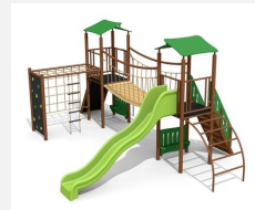
BS.110.MC Kletterlandschaft 2 steel color