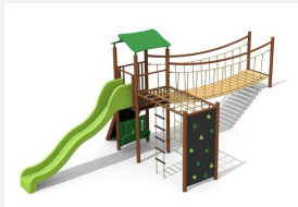
BS.110.1.MC Kletterlandschaft 2 an Hügel steel color