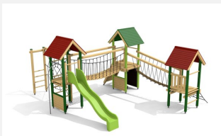
BS.120.L Kletterlandschaft 3 - farbig lasiert