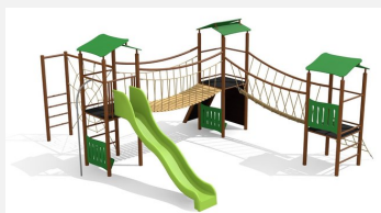
BS.120.MC Kletterlandschaft 3 steel color