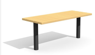
BT.021.T.C Tisch Sola - color