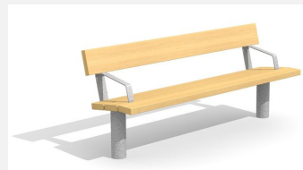
BT.021.BA Bank Sola mit Armlehne