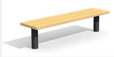
BT.021.H.C Hockerbank Sola - color