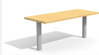
BT.021.T Tisch Sola