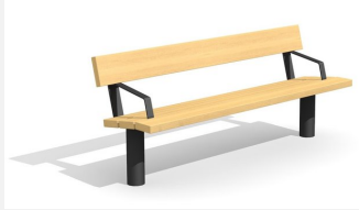
BT.021.BA.C Bank Sola mit Armlehne - color