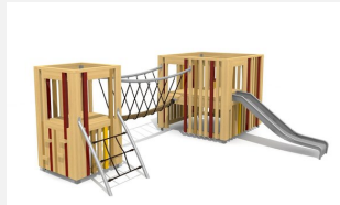
BX.050.2.L Spieldorf SCHANG - lasiert