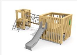
BX.050.2 Spieldorf SCHANG