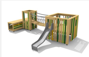
BX.050.4.L Spieldorf HAI - lasiert