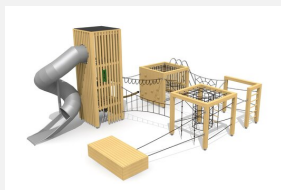
BX.150.2 bimbox Spielwelt LON