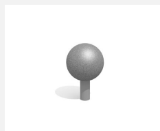
C804.1.3.I Der kleine Standpunkt in Edelstahl