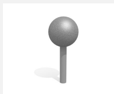
C806.1.3.I Der grosse Standpunkt Edelstahl