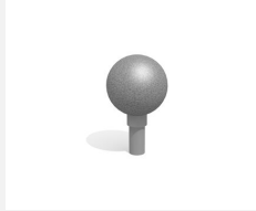
C808.1.3 Der springende Punkt