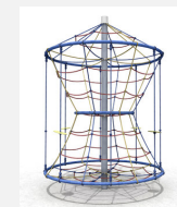
DR.061.1.C Flitzer L 220 - color