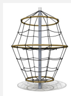
DR.061.1 Flitzer L 220 - nature