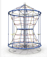
DR.061.2.C Karussell L 220 - color