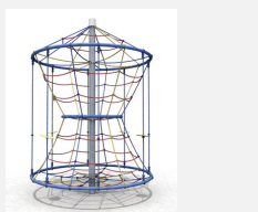
DR.061.1.C Flitzer L 220 - color