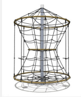
DR.061.2 Karussell L 220 - nature