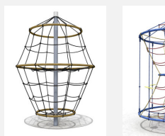
DR.061.1 Flitzer L 220 - nature