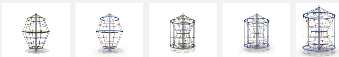
DR.060.1 Flitzer M 150 - nature