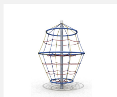
DR.060.1.C Flitzer M 150 - color