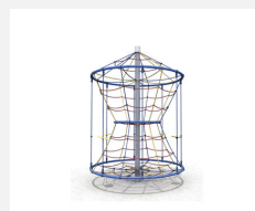
DR.060.2.C Karussell M 150 - color