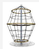
DR.061.1 Flitzer L 220 - nature