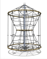
DR.061.2 Karussell L 220 - nature