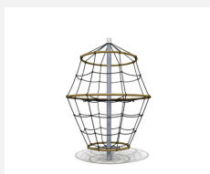
DR.060.1 Flitzer M 150 - nature