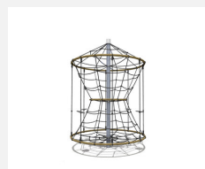
DR.060.2 Karussell M 150 - nature