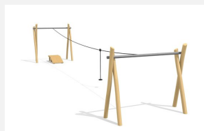
FA.020.2.R Seilbahn mit Startrampe - nature