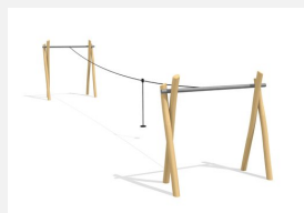
FA.020.1.R Seilbahn auf Hügel - nature