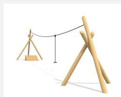
FA.022.2.R 3-Bein Seilbahn nature mit Startrampe