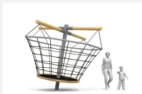
FA.060.2 Die grosse Zentrifuge