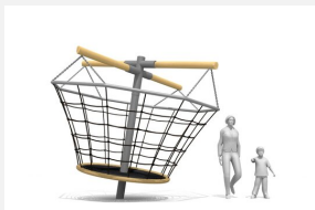
FA.060.2.R Die grosse Zentrifuge - nature