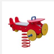
FG.030.062.PE Fliegende Kiste