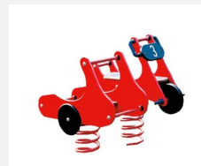
FG.040.630.PE Knattermax mit Seitenwagen