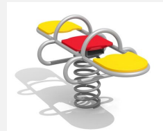
FG.090.430.G Doppelwippe - Edelstahl gelb