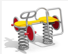
FG.090.420.G Motorrad mit Beiwagen - Edelstahl