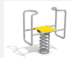
FG.090.450.G Stehwippe - Edelstahl gelb