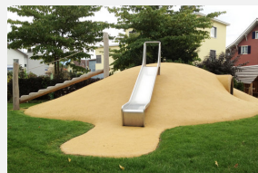
FS.050.30 EPDM Gummigranulat Fallschutzboden 300