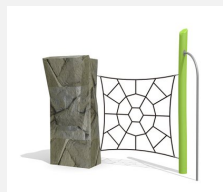
KL.006.1.L Climber 1 - lasiert