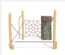
KL.006.3 Climber 3