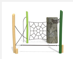
KL.006.3.L Climber 3 - lasiert