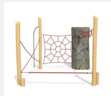
KL.006.3 Climber 3