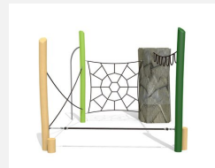
KL.006.3.L Climber 3 - lasiert