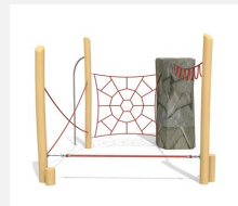
KL.006.3 Climber 3