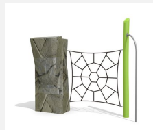
KL.006.1.L Climber 1 - lasiert