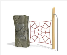
KL.006.1 Climber 1