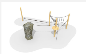
KL.008.2 Fels-Seilgarten 2