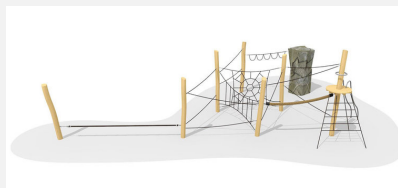
KL.008.4 Fels-Seilgarten 4