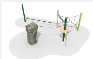
KL.008.2.L Fels-Seilgarten 2 - lasiert