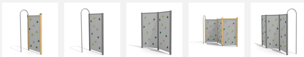
KL.080.1 Kletterwand 1 - Holz KL.080.1.M Kletterwand 1 - Metall KL.080.2.M Kletterwand 2 - Metall KL.080.3 Kletterwand 3 - Holz KL.080.3.M Kletterwand 3 - Metall