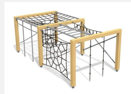
KL.150.2.20 Kletterquader Holz 2, Höhe 200 cm