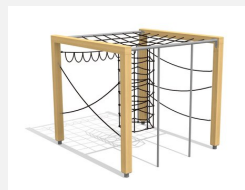
KL.150.1.25 Kletterquader Holz 1, Höhe 250 cm