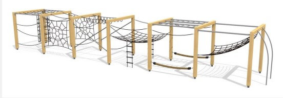
KL.150.6.25 Kletterquader Holz 6, Höhe 250 cm