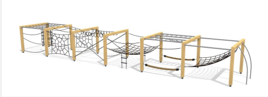
KL.150.6.20 Kletterquader Holz 6, Höhe 200 cm