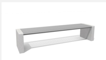
MO.11.02.M Hockerbank Gravi Metall