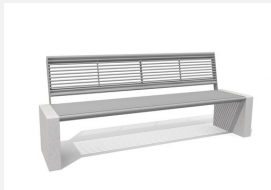
MO.11.00.M Bank Gravi Metall ohne Armlehnen