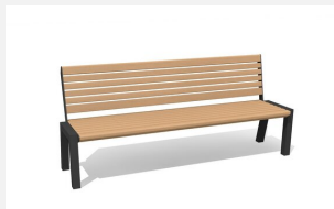
MO.12.02.H Bank Quat - Hartholz