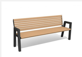
MO.12.01.H Bank Quat - mit Armlehnen Hartholz