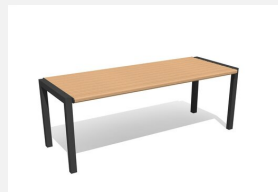
MO.12.04.H Tisch Quat - Hartholz