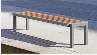
SOPR.035 Hockerbank Qua - Hartholz NEU - Sonderangebot