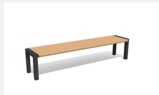
MO.12.03.H Hockerbank Quat - Hartholz