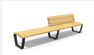
MO.17.22.R Bank Cado levis m. Teilrückenlehne 3 m rechts