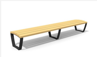
MO.17.21 Bank Cado Levis ohne Lehne 3.0 m