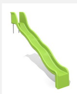
RU.010.20.W Hangrutsche mit Welle - H