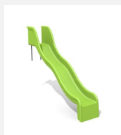
RU.010.15.W Hangrutsche mit Welle - H 150 cm