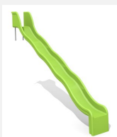
RU.010.25.W Hangrutsche mit Welle - H 250 cm